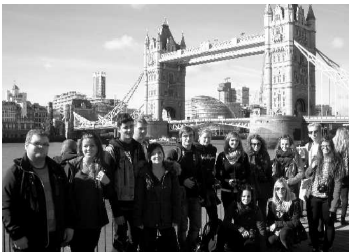
JAZYKOVÉ-VZDĚLÁVACÍ pobyt byl pro studenty časově náročný, ale pořídili se nejen zdokonalit v angličtině, ale prohlédnout si i velké množství památek.

želi certifikát z jazykového kurzu. Po výuce se opět vrátili do hostitelských rodin.